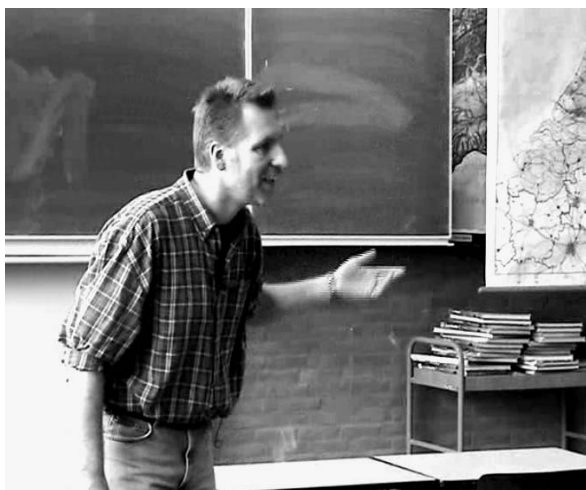
Ausschnitte aus einer Unterrichtsdokumentation, die als Grundlage für die Erarbeitung von Beratungsstrategien dient.

eine Hochschule für die Ausbildung von Lehrer/innen. Mit Hilfe von EU-Förderprogrammen (Sokrates, Erasmus) ist es möglich, den regelmäßigen Austausch von Studenten und Lehrenden pflegen. So waren im letzten Jahr z.B. drei Studierende der PH Karlsruhe für ein Semester an der